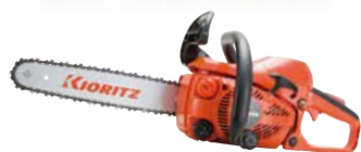
スタート CS271W/30RC25 エンジン: 26.9cm 3 質量: 3.1kg 標準バー長さ: 30cm (スプロケットノーズ) 25APチェン 希望小売価格 (税込) ¥83,050