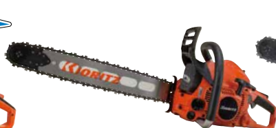
スタート CS500DE(H)/50RV21 EGO エンジン: 50.2cm 3 質量: 4.8kg (5.0kg) 標準バー長さ: 50cm (スプロケットノーズ) 218PX 希望小売価格 (税込) ¥198,000 (¥212,300)