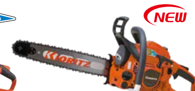
スタート CS38RS/35R25 エンジン: 38.4cm 3 質量: 4.5kg 標準バー長さ: 35cm (スプロケットノーズ) 25APチェン 希望小売価格 (税込) ¥131,450