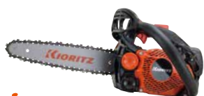
スタート CS252T/25(20)RCS25 エンジン: 25.0cm 3 質量: 2.3kg 標準バー長さ: 25cm (20cm) (先細スプロケットノーズ) 25APチェン 希望小売価格 (税込) ¥80,300 (¥78,100)