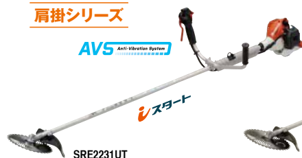
SRE2231GT(UT,LT) エンジン: 20.9cm 3 質量: 3.2kg (3.5kg, 3.4kg) 9インチチップソー付 希望小売価格 (税込) ¥66,000