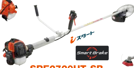
SRE2720UT-SB エンジン: 25.4cm 3 質量: 5.2kg 10インチチップソー付 希望小売価格 (税込) ¥96,800