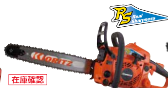
在庫確認 スタート CS37RS/35RVD91 エンジン: 37.7cm 3 質量: 4.4kg 標準バー長さ: 35cm (スプロケットノーズ) 91VXLチェン 希望小売価格 (税込) ¥111,100