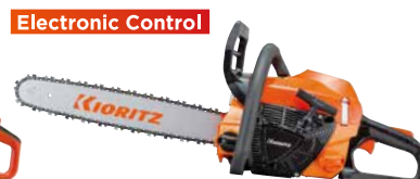
スタート CS410-EC/40S95 EGO エンジン: 41.6cm 3 質量: 4.2kg 標準バー長さ: 40cm (スプロケットノーズ) 95TXLチェン 希望小売価格 (税込) ¥93,500