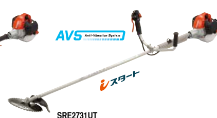
SRE2731UT(GT,LT) エンジン: 25.4cm 3 質量: 4.6kg (4.2kg, 4.4kg) 10インチチップソー付 希望小売価格 (税込) ¥84,700