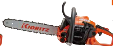
super スタート CS358-S/35S25 EGO エンジン: 35.2cm 3 質量: 4.0kg 標準バー長さ: 35cm (スプロケットノーズ) 25APチェン 希望小売価格 (税込) ¥91,850