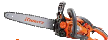
スタート CS252W/30SC25 エンジン: 25.0cm 3 質量: 2.6kg 標準バー長さ: 30cm (先細スプロケットノーズ) 25APチェン 希望小売価格 (税込) ¥79,200