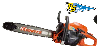
スタート CS43RS(H)/45R21 EGO エンジン: 42.9cm 3 質量: 4.3kg (4.6kg) 標準バー長さ: 45cm (スプロケットノーズ) 218PXチェン 希望小売価格 (税込) ¥161,700 (¥179,300)