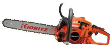
スタート CS358/35S25 EGO エンジン: 35.2cm 3 質量: 3.9kg 標準バー長さ: 35cm (スプロケットノーズ) 25APチェン 希望小売価格 (税込) ¥89,650