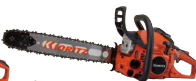
スタート CS480/45RV21 EGO エンジン: 50.2cm 3 質量: 4.8kg 標準バー長さ: 45cm (スプロケットノーズ) 218PXチェン 希望小売価格 (税込) ¥122,100