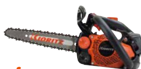
スタート CS252T/25(20)C25 エンジン: 25.0cm 3 質量: 2.3kg 標準バー長さ: 25cm (20cm) (カービング) 25APチェン 希望小売価格 (税込) ¥84,700 (¥82,500)