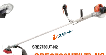
SRE2730UT(LT)-N2 エンジン: 25.4cm 3 質量: 4.8kg (4.6kg) ナイロンカッターDS-5A付 希望小売価格 (税込) ¥85,800

※ 型式語尾のU、G、Lは操作桿のハンドルタイプを表します。U: Uハンドル、G: 2グリップ、L: ループハンドル