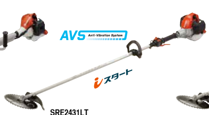
SRE2431LT(UT,GT) エンジン: 22.8cm 3 質量: 4.1kg (4.3kg, 3.9kg) 10インチチップソー付 希望小売価格 (税込) ¥72,600