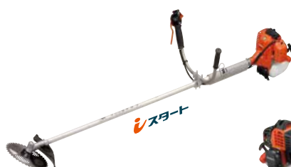
SRE3600UT エンジン: 34.0cm 3 質量: 6.6kg 10インチチップソー付 希望小売価格 (税込) ¥104,500