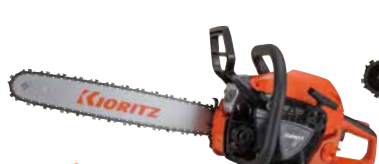
スタート CS450/45R95 EGO エンジン: 45.0cm 3 質量: 5.0kg 標準バー長さ: 45cm (スプロケットノーズ) 95TXLチェン 希望小売価格 (税込) ¥111,100