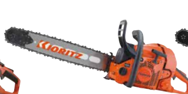
CS610/50RSD73 エンジン: 59.8cm 3 質量: 6.2kg 標準バー長さ: 50cm (スプロケットノーズ) 73DPXチェン 希望小売価格 (税込) ¥245,300