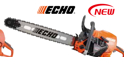
ECHO CS7330P(H)/60R73 エンジン: 73.5cm 3 質量: 6.7kg (6.9kg) 標準バー長さ: 60cm (スプロケットノーズ) 73DPXチェン 希望小売価格 (税込) ¥289,300 (¥305,800)